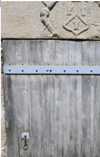
un linteau de porte du moulin de Pontabrier

7 Traverser le hameau. Au croisement, prendre à gauche la RD60 qui remonte puis au carrefour de routes suivant, prendre à droite le chemin en herbe. Poursuivre sur ce chemin qui surplombe l'étang de Pontabrier. Descendre au moulin et poursuivre sur cette petite route qui longe le Vincou.