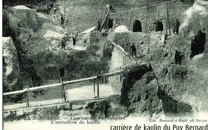
LA JONCHERE - Carrières du Puy-Bernard. L'extraction du kaolin. Edit. Bonnaud et Bayle, ph. Bayle