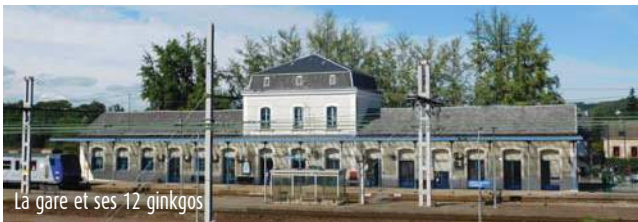
La gare et ses 12 ginkgos

En 1864, lors de la construction de la gare, l'ingénieur en chef, monsieur de Leffe, qui dirigeait les travaux, était devenu, au cours d'un voyage au Japon, l'ami intime du frère de l'Empereur du Japon. Lors de sa visite, le prince impérial avait apporté un certain nombre de plants dans les bagages, dont une douzaine de ginkgos, arbres qui, à l'époque, étaient considérés comme sacrés. M. de Leffe décida de les planter à Saint-Sulpice-Laurière. Ils trouvèrent là un terrain favorable puisqu'ils atteignent aujourd'hui la taille de 20 m. (Source commune)