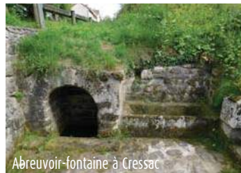
Abreuvoir-fontaine à Cressac

Son nom vient de la présence d'une papeterie royale où l'on fabriquait en 1769 les papiers aux filigranes "raisin" et "nom de Jésus". Les filigranes apparaissent à partir du XVIIIème siècle. L'étang, d'une superficie de plus de 6 ha, est traversé par le Rivalier. Il est réservé à la pêche. (Source commune)