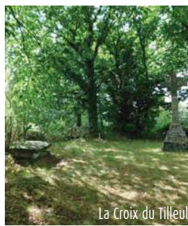
La Croix du Tilleul

Aller-retour (700 m) : prendre à droite, puis à gauche, le chemin qui mène à la Croix du Tilleul.