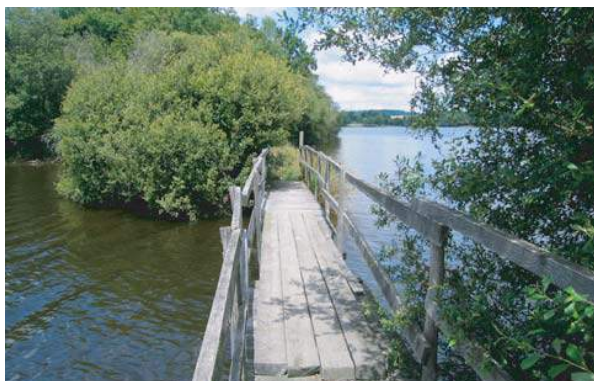
Les passerelles du lac de Saint-Pardoux

7 Traverser la RD 248 en face du parking du pont de Santrop (sanitaires et restauration en période estivale.). Longer le parking puis suivre la piste cyclable goudronnée. Arriver au bord du lac, tourner à gauche en suivant les rives jusqu'à Friaudour.