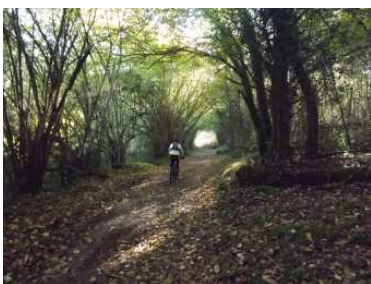
Un chemin en sous-bois

La "vallée de la Glayeule" est une vaste zone humide remarquable de par sa richesse tant floristique que faunistique. On y rencontre principalement un grand marais eutrophe de basse altitude (riche en éléments nutritifs apportés par la rivière), des prairies à Molinie, des mégaphorbiaies avec de grandes herbes luxuriantes et, des zones plus nues, avec présence d'une plante carnivore ou plus boisées (saulaies).