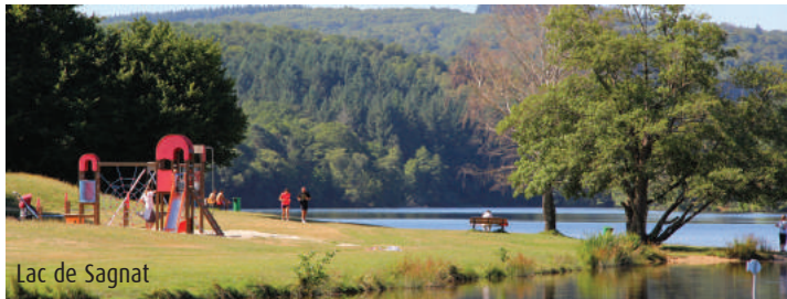
Lac de Sagnat

7 Après avoir parcouru 1 km, laisser le chemin principal et suivre le sentier à droite qui entre dans la forêt. Poursuivre tout droit et passer la chicane. A la 2ème chicane, prendre de suite à droite le petit chemin bordé par un muret. Au bout, tourner à gauche et continuer jusqu'au chemin du Prix.